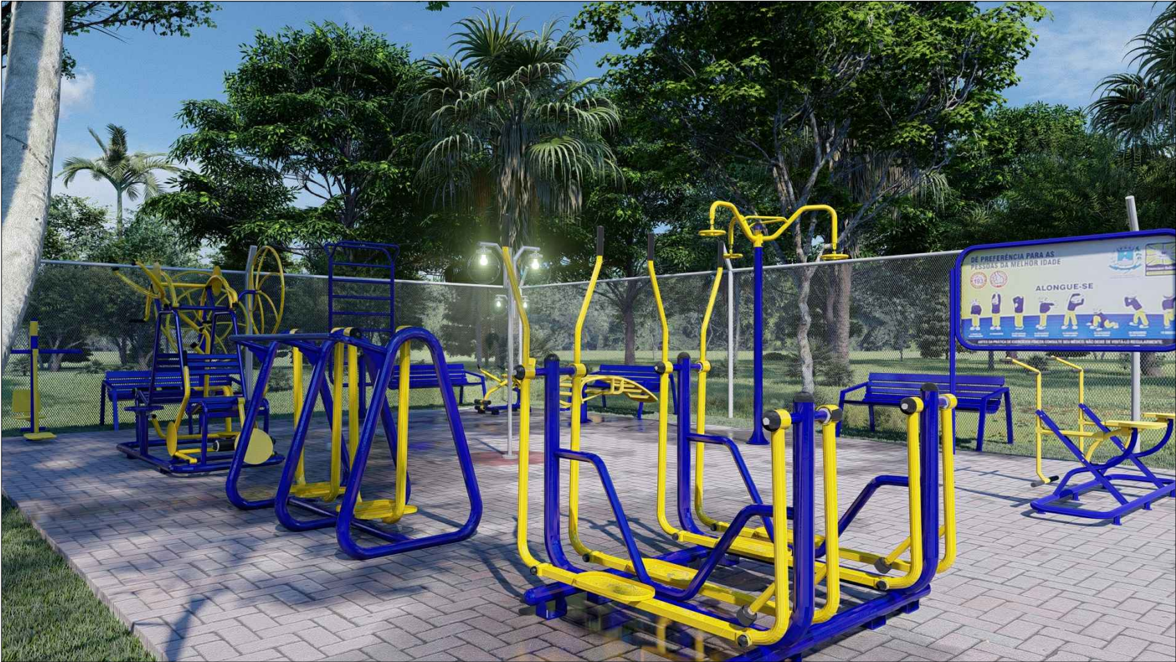
PERSPECTIVA 3D - 06 ESC: SEM ESCALA