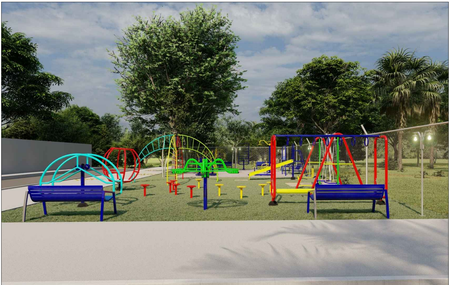
PERSPECTIVA 3D - 03 ESC: SEM ESCALA