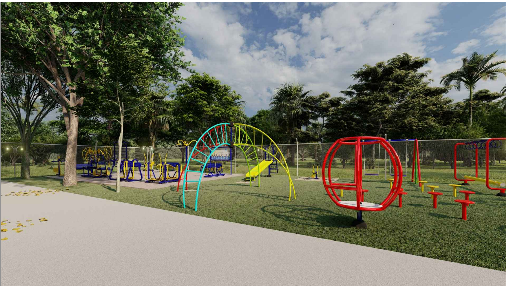
PERSPECTIVA 3D - 01 ESC: SEM ESCALA