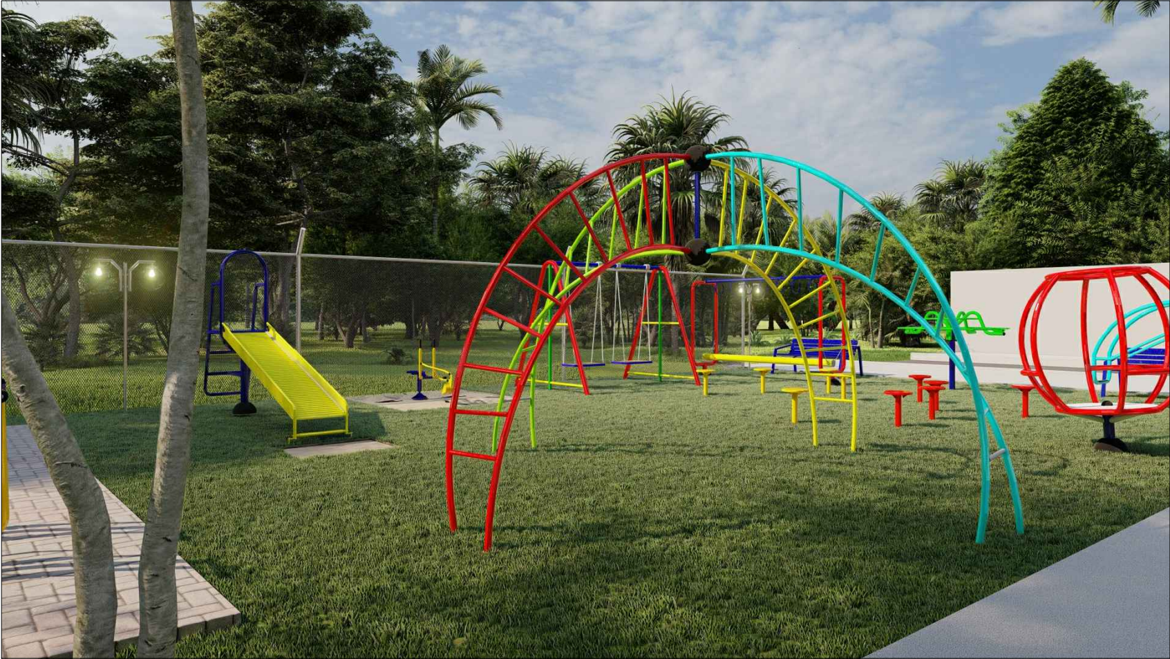
PERSPECTIVA 3D - 04 ESC: SEM ESCALA