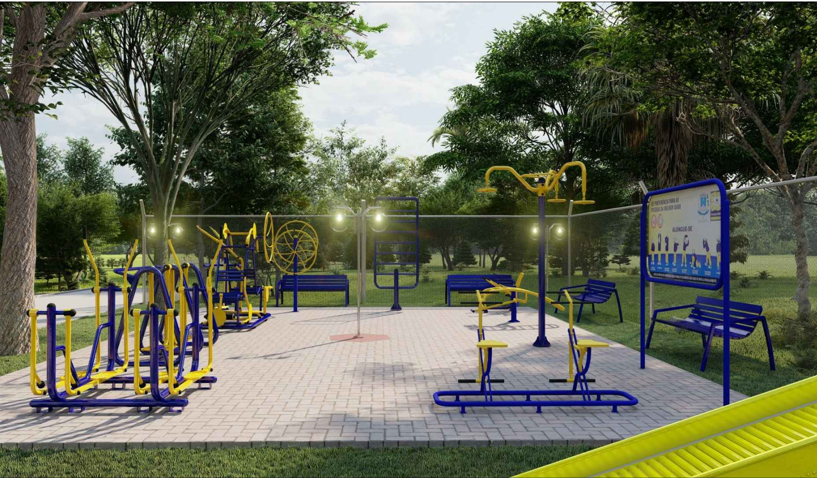
PERSPECTIVA 3D - 07 ESC: SEM ESCALA