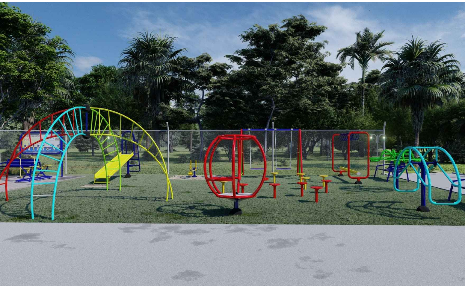
PERSPECTIVA 3D - 02 ESC: SEM ESCALA