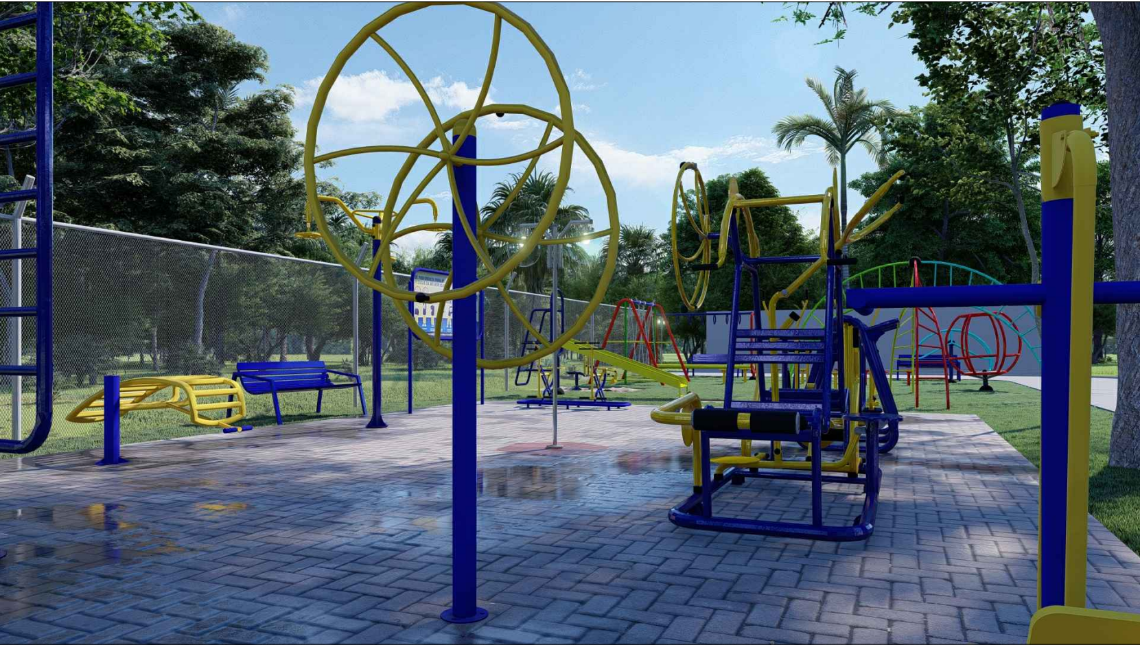
PERSPECTIVA 3D - 05 ESC: SEM ESCALA